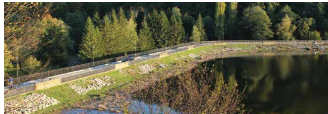
Проект – BG16M1OP002-4.004-0001 „Рехабилитация на язовир „Синкевица“ и съоръженията към него, находящ се в кв. „Славоци“, гр. Габрово“

Разположен в близост до кв. „Славоци“ на площ от 114 065 м 2 , непосредствено до обходния път на гр. Габрово (един от най-големите инфраструктурни обекти в Република България). Язовирът е построен през 1963 г. за промишлено водоснабдяване на предприятия в Габрово и за ретензия (загържане) на водните обеми по поречието на р. Синкевица. Язовирната стена е земно-насипен тип с каменна заскалявка на водния откос. Височината ѝ е 12 метра.