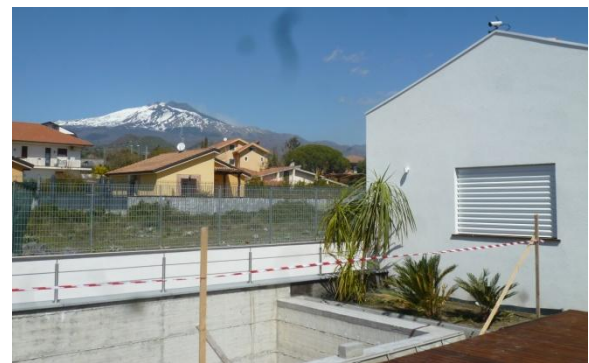
Първата пасивна къща в Сицилия