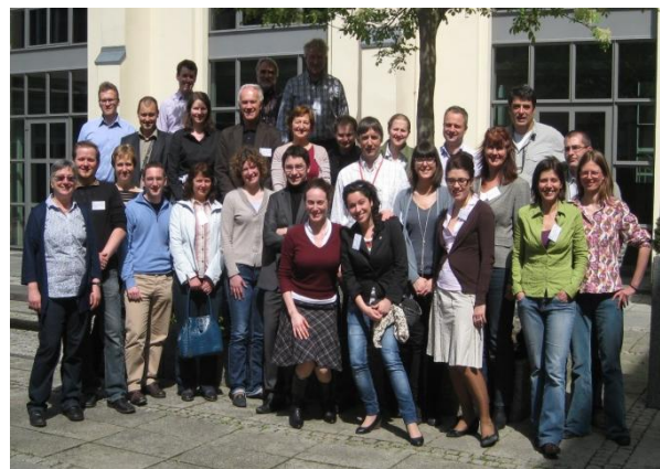
Участниците в първата работна среща на PassREg

Последните събития и резултати от проекта бяха обсъдени в рамките на 17-ата Международна конференция Пасивна къща, която се проведе в друг напреднал регион - Франкфурт. Водещата роля на Франкфурт в енергийно ефективното строителство е очевидна: с активна политика за подкрепа, повече от 1 600 апартамента, както и множество училища, детски градини и други нежилищни сгради са построени според стандарта „Пасивна къща“. Серия от опознавателни визити предложиха възможност на участниците да посетят завършени и текущи строителни проекти във Франкфурт и Хайделберг. Само на 100 километра южно от Франкфурт, в Хайделберг - друг водещ регион, изследван от PassREg - в момента се изгражда цял градски район с площ от 116 хектара в съответствие със стандарта „Пасивна къща“.