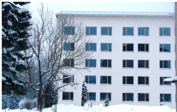
Професионална гимназия, Ергли

Общежитието на професионалната гимназия в Ергли е обновено с компоненти за пасивна сграда. Този проект е пример за постигане на отлични енергийни и екологични стандарти при обновявания и показва ползите за подобряване на качеството на обитаване. Развитието на професионалната гимназия от своя страна помага за подобряване на образователната инфраструктура на целия регион Ергли. Подробности за проекта