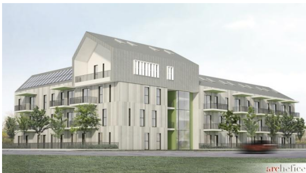
Case Finali / студио Archefice associate