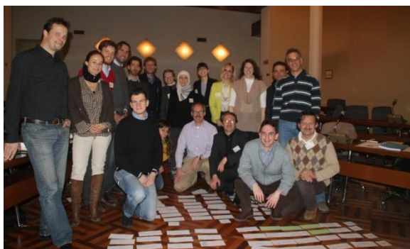
Обучение на преподаватели за сертифициране на проектантите и строителни специалисти в Чезена, Италия

Квалифицираните проектантите и строители са ключът за широкото навлизане на сградите с близко до нулево нетно потребление на енергия. В рамките на PassREg съществуващите курсове за проектантите и строителни специалисти, разработени преди това от Институт Пасивна къща, се превеждат на различни европейски езици и се адаптират към регионалните климатични условия и строителни традиции. За да се гарантира, че такива обучения ще бъдат организирани и след трите години на проекта PassREg, бъдещи преподаватели от различни страни от ЕС се обучават за провеждане на тези курсове в цяла Европа.