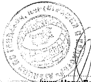
Схема № 15-389433-14.08.2017 г. издадена въз основа на документ с входящ № 01-246748-11.08.2017 г.

Акт за частна общинска собственост № 111 том 5 рег. 1840 от 06.07.2017г., издаден от АВ - СЛУЖБА ПО ВПИСВАНИЯТА - ГР. ГАБРОВО