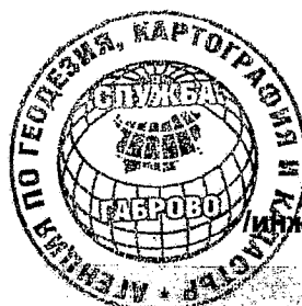
Схема № 15-433434-28.05.2020 г. издадена въз основа на заявление с входящ № 01-207693-26.05.2020 г.

Акт за частна общинска собственост № 339 от 14.07.1997г., издаден от ОБЩИНА ГАБРОВО