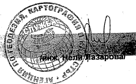
Схема № 15-105684-07.02.2019 г. издадена въз основа на документ с входящ № 01-50279-06.02.2019 г.