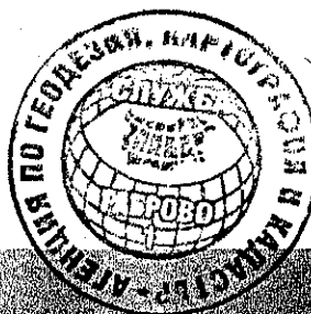
Схема № 15-106898-13.03.2017 г. издадена въз основа на документ с входящ № 01-67147-09.03.2017 г.