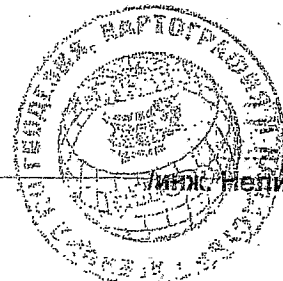
Схема № 15-105678-07.02.2019 г. издадена въз основа на документ с входящ № 01-50279-06.02.2019 г.