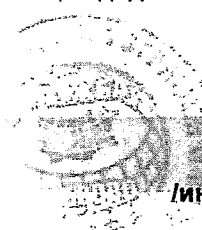
Схема № 15-827037-13.08.2024 г. издадена въз основа на заявление с входящ № 01-443919-13.08.2024 г.

Акт за публична общинска собственост № 67 том I рег. 134 от 24.01.2013г., издаден от АВ - СЛУЖБА ПО ВПИСВАНИЯТА - ГР. ГАБРОВО