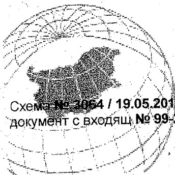
Схема № 3064 / 19.05.2012 г. е издадена въз основа на документ с входящ № 99-2552 / 18.05.2012 г.