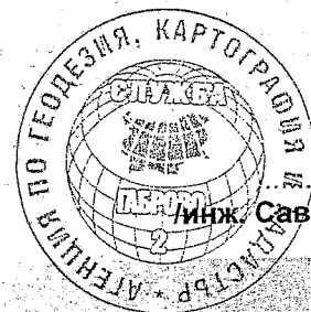
Схема № 15-1100982-24.11.2020 г. издадена въз основа на заявление с входящ № 01-549646-24.11.2020 г.