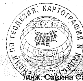
Схема № 15-295711-21.03.2022 г. издадена въз основа на заявление с входящ № 01-144809-16.03.2022 г.