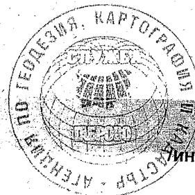
Схема № 15-165214-16.02.2022 г. издадена въз основа на заявление с входящ № 01-77396-11.02.2022 г.