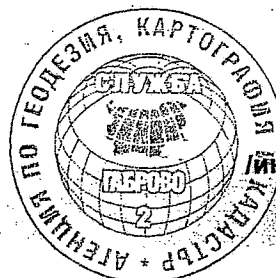
Схема № 15-28542-16.01.2019 г. издадена въз основа на документ с входящ № 01-10394-15.01.2019 г.

Акт за частна общинска собственост № 170 том V рег. 1637 от 26.05.2006г., издаден от АВ - СЛУЖБА ПО ВПИСВАНИЯТА - ГР. ГАБРОВО