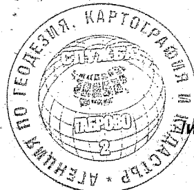
Схема № 15-368734-23.04.2019 г. издадена въз основа на документ с входящ № 01-124246-21.03.2019 г.