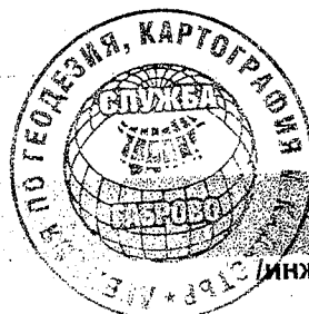
Схема № 3056 / 19.05.2012 г. е издадена въз основа на документ с входящ № 99-2552 / 18.05.2012 г.