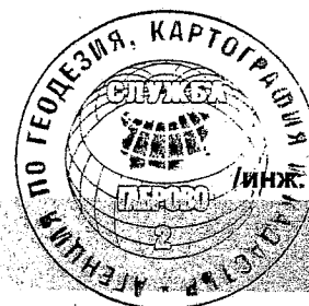
Схема № 15-544290-18.06.2019 г. издадена въз основа на документ с входящ № 01-261865-14.06.2019 г.

Акт за частна общинска собственост № 68 том 5 рег. 1601 от 07.06.2019г., издаден от АВ - СЛУЖБА ПО ВПИСВАНИЯТА - ГР. ГАБРОВО