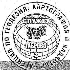
Схема № 15-790342-28.08.2020 г. издадена въз основа на заявление с входящ № 01-388568-27.08.2020 г.

Акт за частна общинска собственост № 92 том 6 рег. 1800 дело 703 от 17.08.2020г., издаден от АВ - СЛУЖБА ПО ВПИСВАНИЯТА - ГР. ГАБРОВО