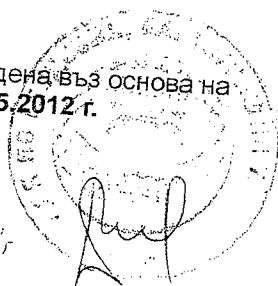
Схема № 3058 / 19.05.2012 г. е издадена въз основа на документ с входящ № 99-2552 / 18.05.2012 г.