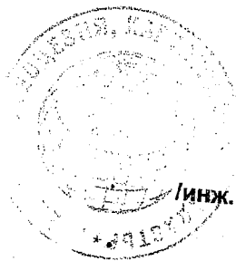
Схема № 2194 / 18.04.2012 г. е издадена въз основа на документ с входящ № 99-1813 / 11.04.2012 г.