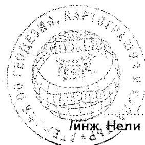
Схема № 1404 / 16.03.2012 г. е издадена въз основа на документ с входящ № 99-1202 / 14.03.2012 г.

Акт за публична общинска собственост № 167 том I рег. 353 от 02.03.2012г., издаден от АВ - СЛУЖБА ПО ВПИСВАНИЯТА - ГР. ГАБРОВО